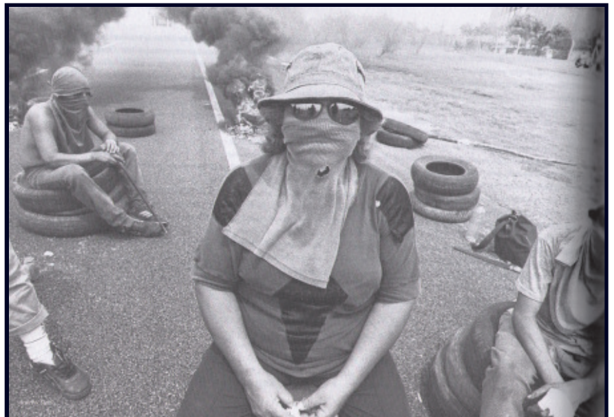
Während der Wirtschaftskrise in Argentinien (2001) unterbrechen die Piqueteros mit Straßenblockaden die Warenzirkulation.

erschüttert werden, ist die Stimmung gekippt: Alle wenden sich an den Staat und distanzieren sich bis auf einige isolierte Stimmen von Hardcore-Liberalen vom Liberalismus. Niemals war seit der neoliberalen Wende in den 1970er Jahren in der Wirtschaft die Sehnsucht nach dem Staat so hoch wie heute. Dabei sind die Parallelen zwischen der heutigen Krise und der damaligen Krise des Keynesianismus, die die neoliberale Wende auslöste, so verblüffend, dass man den Eindruck bekommt, bloßer Zuschauer einer Farce mit dem Titel „Das war nur ein Scherz“ zu sein. Die verbreitete Vorstellung, das kapitalistische System sei ohne einen engen staatlichen Regulierungsrahmen, der es vor sich selbst schützte, nicht überlebensfähig, hatte in der frühen Nachkriegszeit zahlreiche staatliche Eingriffe in die Wirtschaft legiti-